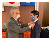
←年次例会で会長ピンの受け渡し