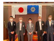
第一例会で前期三役へ感謝のピン→