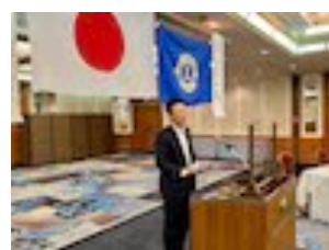
L和氣の話術は最高！