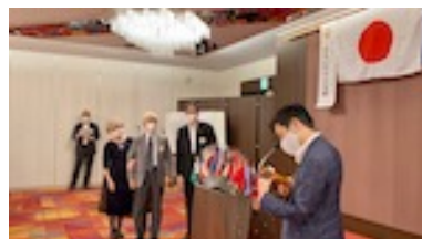
10月のお誕生日祝い L山腰 L其浦 L明山 L団