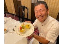
3点の写真は第1266回例会のスナップショットです